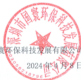
废气处理设施分项费用清单